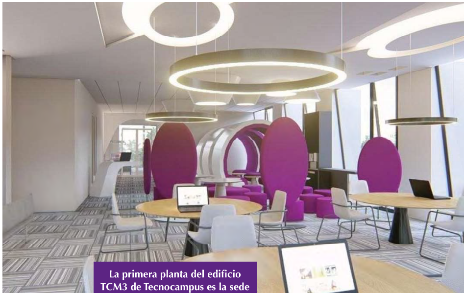
La primera planta del edificio TCM3 de Tecnocampus es la sede de la primera antena de TrenLab.

En este sentido, el Ayuntamiento de Mataró fomenta la integración ciudadana, con la posibilidad de crear en el municipio laboratorios en vivo para pruebas de la implantación de las soluciones creadas.