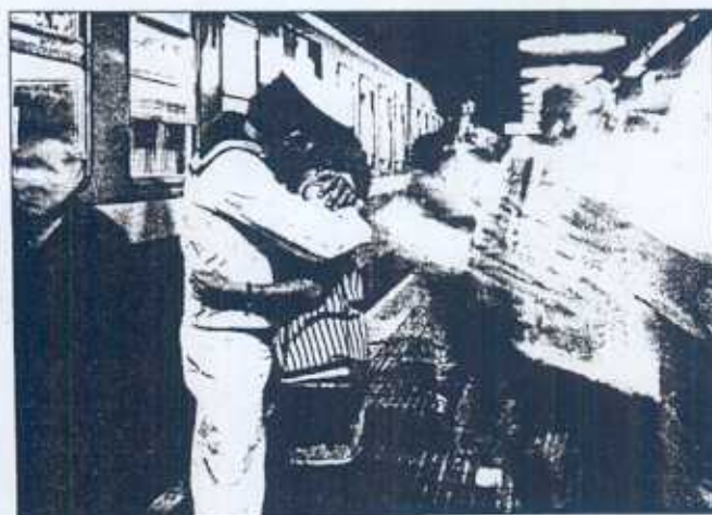
Ejemplo de las despedidas que se suceden en las estaciones.