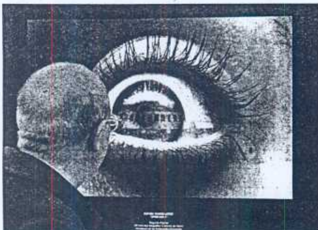
Un visitante contempla el reflejo del tren a través del globo ocular.