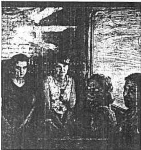
Varias mujeres retratadas en el compartimento de un tren.