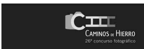
Cartel 'Caminos de Hierro'.