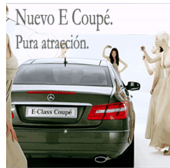
Foto: Publicidad y Moda Curso Imprescindible: Convertirte en un Profesional de la Fotografía! Anuncios Google