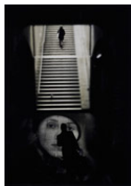
2011 - "Berlin Krefeld Hbf", Antonio Manzano

Españoles (Santa Isabel 44 - 28012 Madrid), hasta el día 11 de noviembre de 2011, indicando en el sobre 26º "Caminos de Hierro" y el número de fotografías que contiene.