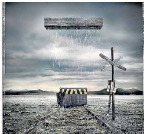
Accésit para 'Rainman' del fotógrafo catalán autodidacta.