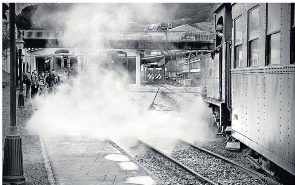
'Próxima parada', galardonada con el Premio Autor Joven. :: IÑIGO MONTOYA