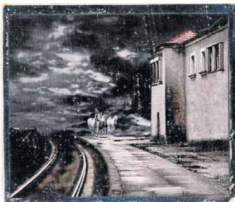
'Sin título I'. Accésit para el fotógrafo cubano. :: JORGE ALONSO MOLINA