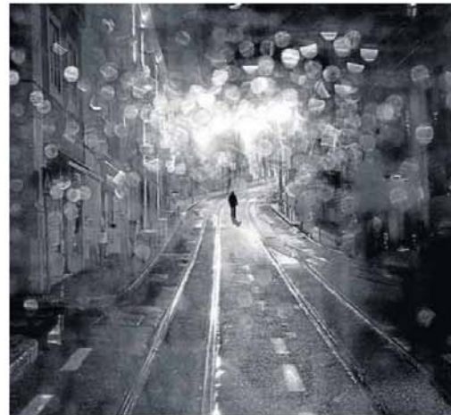
'Lisboa', imagen distinguida con un accésit. :: ISABEL MUNUERA