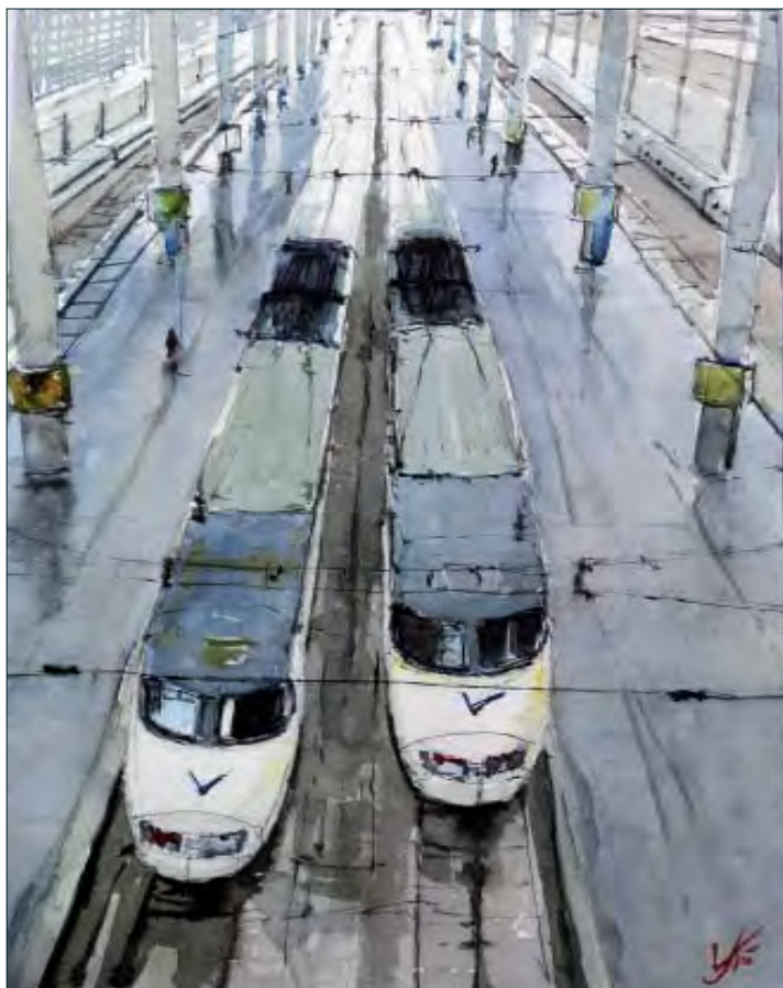
JACQUES VILLARES. Aves en Atocha. Acuarela. 30 x 45 cm