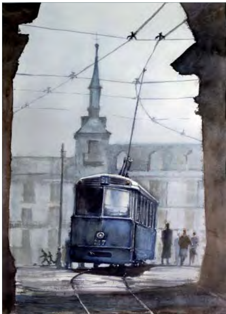
JORGE ACKERMAN. Vías sin tiempo. Acuarela. 36 x 53 cm