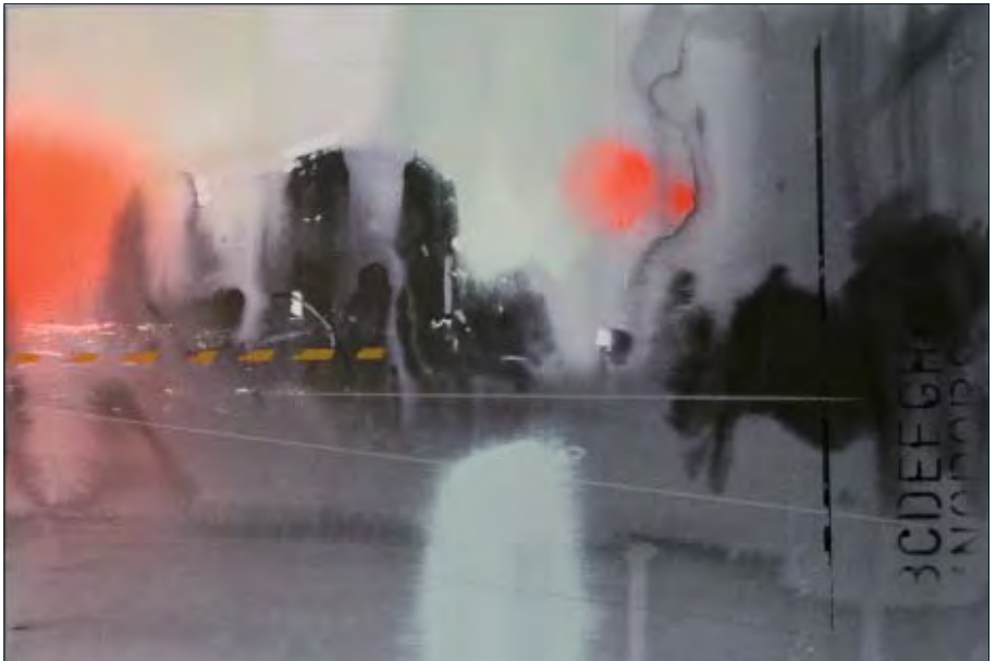
EMILIO CÁRDENAS. Patio de maniobras. Acuarela. 50 x 35 cm