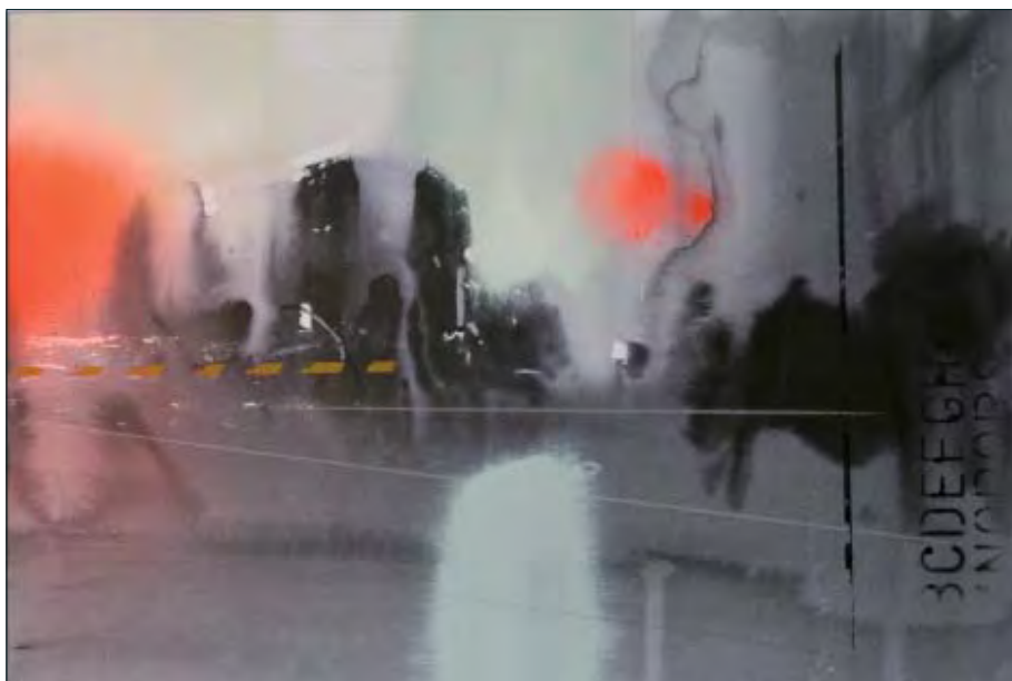
EMILIO CÁRDENAS. Patio de maniobras. Acuarela. 50 x 35 cm