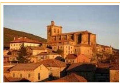
Día 20. Vinuesa