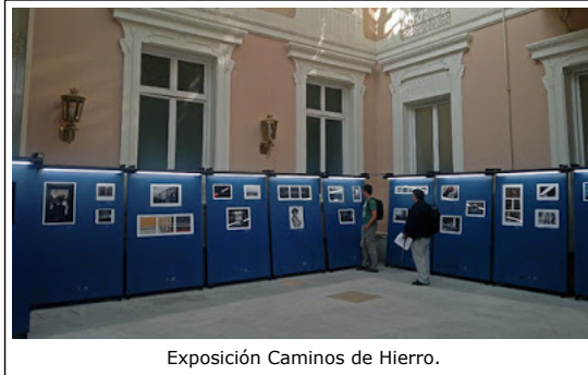
Exposición Caminos de Hierro.

Un clásico de los concursos fotográficos es el que organiza la Fundación de los Ferrocarriles Españoles en el que el tren sirve como fuente de inspiración. Este año ha celebrado su 29 edición y a él se han presentado más de 1595 autores con un total de 3697 fotografías. Un concurso cuya fama ha saltado fronteras hasta tal punto que los participantes procedían de 62 países diferentes.