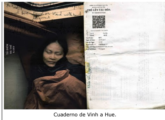
Cuaderno de Vinh a Hue.

Estas tres obras, más otras 38 en formato papel y 108 en formato digital conforman la Exposición " Caminos de Hierro " que podrá visitarse en el Palacio de Fernán Núñez , situado en la calle Santa Isabel 44 de Madrid , hasta el 19 de octubre. Los horarios de visita de esta sala, situada muy cerca del Museo Reina Sofía , es de 10:00 a 20:00 horas de lunes a viernes.